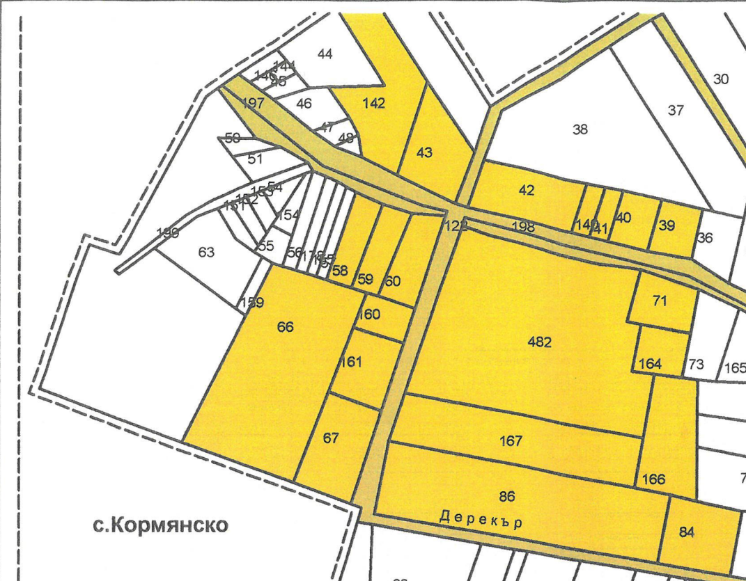
Извадка от действащия ОУПО Севлиево за ПИ 38652.18.67 и ПИ 38652.18.160 по ККР на с.Кормянско ,м. ДЕРЕ КЪР ,Общ. Севлиево М 1:2000